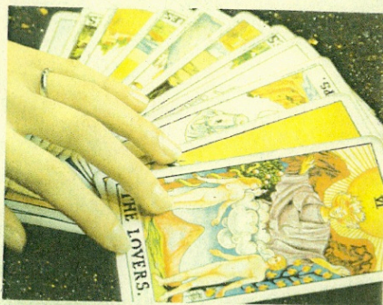
↑ 揭開了一張戀人牌，展開了自己的戀愛故事，無名指上的婚戒見證了一生的承諾。