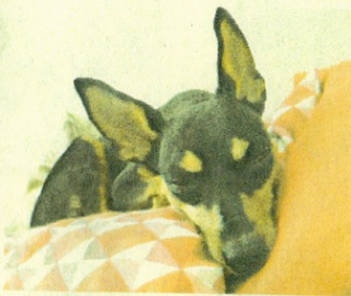
↑ 怕燥又愛撒嬌的小狗兒Bungy，是她與丈夫的心肝寶貝。