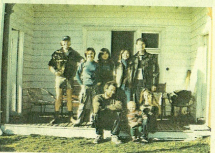
↑ 曾經到新西蘭體驗農夫生活，當地生活簡樸，人們知足常樂，令她留下深刻印象，從此也愛上這個國家。